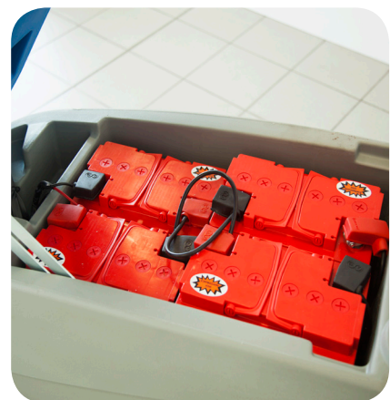
batterie al gel o acido con grande autonomia gel or acid batteries with great autonomy

the oscillating squeegee follows the machine movement