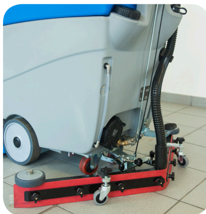
lo squeegee oscillante segue il movimento della macchina

detail of ecosmall 70 r version with double brushes